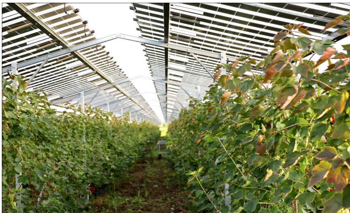
Zonnepanelen boven rode bes

investeren in hagel- of regenbescherming van zijn bessen- of frambozenaanplant. GroenLeven stelt als voorwaarde dat de teler verplicht is de panelen 25 jaar op zijn perceel te laten staan. Op dit moment biedt GroenLeven ook koop- en leaseconstructies aan waarbij de fruitteler zelf eigenaar is van de zonnepanelen. Uitgaande van een vermogen van 0,9 MWp per hectare levert het dak tussen de 900.000 en 1.000.000 kWh elektriciteit per hectare op, aldus GroenLeven. Per hectare zouden 320 tot 350 huishoudens van elektriciteit kunnen worden voorzien. De installatie zou in 15 jaar grotendeels zijn terugverdiend, waarna het jaarlijks zorgt voor een extra inkomstenbron uit opgewekte stroom van € 40.000 tot € 50.000 per hectare.