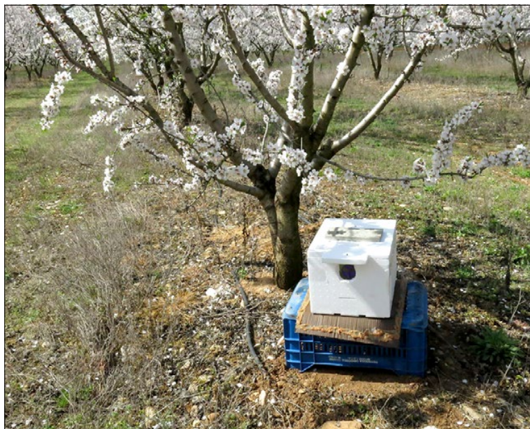
Hommeldoos voorzien van de Bee-Coat ter bescherming tegen kou en regen Biobest

Scan de QR-code om in een instructiefilmje te zien hoe de Bee-Coat eenvoudig om een hommeldoos wordt aangebracht.