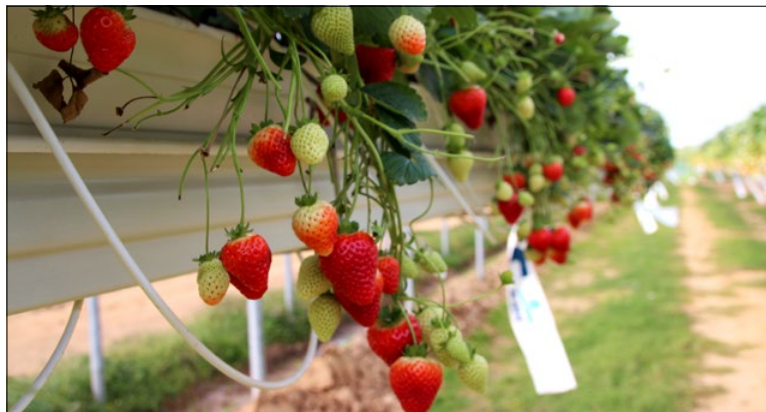
Open dag Auweiler met aandacht voor teelt van aardbeien en houtig kleinfruit

gen gepresenteerd. Thema's zijn dit jaar onder andere tunnelteelt en substraatteelt van aardbeien, teelt van frambozen, bramen en bessen en nieuwe kleinfruitrassen. Diverse firma's tonen hun producten en diensten zoals tunnelsystemen, substraten, stellingen, plantmateriaal, gewasbeschermingsmiddelen en meststoffen. De 'Auweiler Tunneltag' opent om 10:00 uur en duurt tot 16:00 uur. Adres: Versuchszentrum Gartenbau Straelen / Köln-Auweiler Gartenstraße 11 in 50765 Köln-Auweiler - Duitsland. Tijdens de bijeenkomst is het 3G-Corona protocol van kracht.