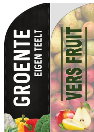
Beachvlaggen zijn leverbaar in 2 maten en met of zonder mast en grondpin. Fruiteeltshop