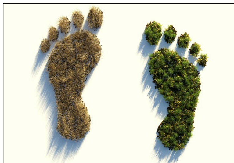
De CO 2 -voetafdruk van de biologische en geïntegreerde teeltwijze verschilt nauwelijks.