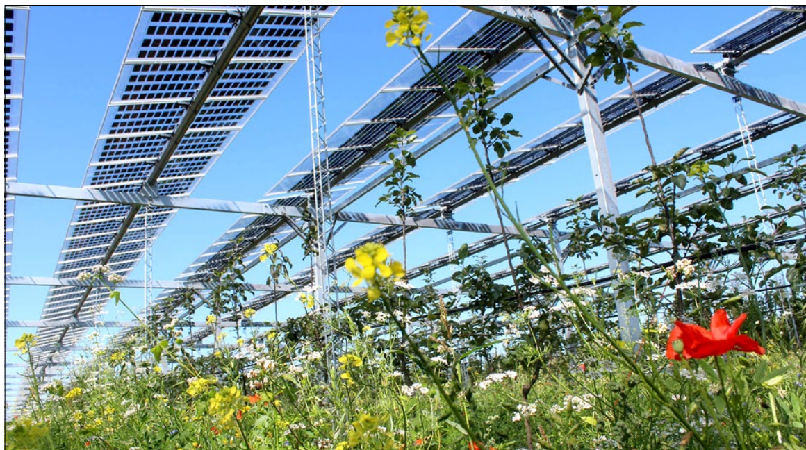
In Duitsland worden diverse zonnepaneelsystemen vergeleken met gangbare teeltbeschermingsystemen.