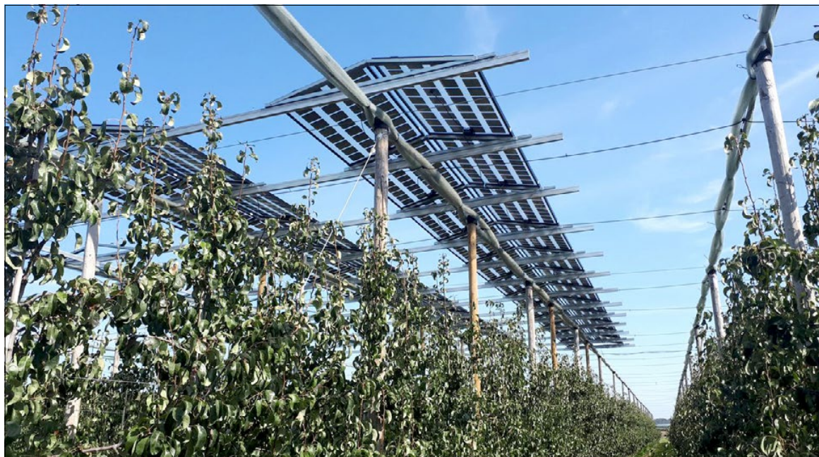
Proef met zonnepanelen boven peer in België.

In Duitsland zijn op het biologische fruitbedrijf Nachtwey in Gelsdorf in Rheinland-Pfalz als proef zonnepanelen boven appelbomen geplaatst. Het totale onderzoeksperceel is 9.100 m 2 groot. Op eenderde van de oppervlakte zijn zonnepanelen met een capaciteit van 258 kWp gebouwd. Binnen het 5 jaar durende project worden bij 8 appelrassen talrijke aspecten onderzocht.