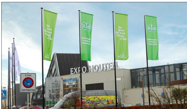
De Fruitteelt vakbeurs is dit jaar op 13 en 14 april

De tweejaarlijkse Fruitteelt Vakbeurs vindt dit jaar plaats op 13 en 14 april 2022. De Fruitteelt Vakbeurs is de enige meerdaagse vakbeurs voor professionele fruittelers in Nederland. Veel toeleveringsbedrijven en dienstverleners voor de fruittelt zijn hier met een stand aanwezig. De beurs is zoals gewoonlijk in de hallen van Expo Houten, Meidoornkade 24 in Houten. De beurs is beide dagen geopend van 13.00 tot 21.00 uur. Toegang en parkeren zijn gratis.