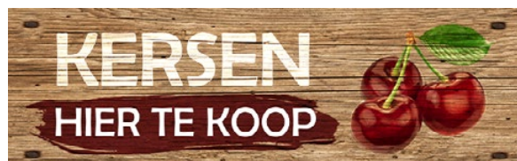
Spandoeken met fruitmotief als aandachtstrekkers langs de weg. Fruiteeltshop

De producten zijn te vinden in de Fruiteeltshop: