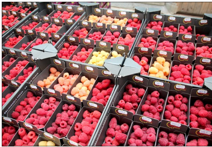
Zijn er herfstframbozenrassen die beter zijn dan Kwanza?

pcfruit al in fase 3 van het rassonderzoek. Sweet Royalla groeit goed en loopt vroeger uit dan Loch Ness. Ook de bloei, en daarmee de oogstpiek is eerder. Wat echter vooral opvalt zijn de grote vruchten. “Op de veiling is speciaal voor dit ras een extra klasse toegevoegd met minder dan 14 vruchten per bakje van 125 gram”. De vruchten van Sweet Royalla smaken volgens Spruyt zoeter dan van Loch Ness, maar dit is alleen in het najaar terug te vinden in het brixgehalte. Vruchtmaat, stevigheid en plukfrequentie zijn vergelijkbaar met Loch Ness.